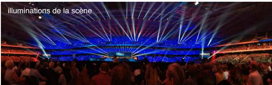
illuminations de la scène

Lille, Stade Pierre Mauroy, Vendredi 2 juin 2017, 20h50. 45000 spectateurs font une ovation sans précédent à l'Orchestre National de Lille qui interprète en direct, sous la baguette de Zahia Ziouani, l'Ouverture de Carmen. C'est le coup d'envoi de l'émission de France 2 : Prodiges, Le Grand Concert. Derrière l'Orchestre, 120 choristes du Chœur Régional des Hauts-de-France. Au-dessus, occupant tout le virage du stade, 10542 jeunes choristes venus de toute la région. Sur scène 50 danseurs du Saint-Petersbourg Ballet. Éclairages insensés, leds étincelants, geysers échevelés, caméras acrobates, voilà planté le décor vertigineux réservé, semblait-il, aux concerts de rock-stars.